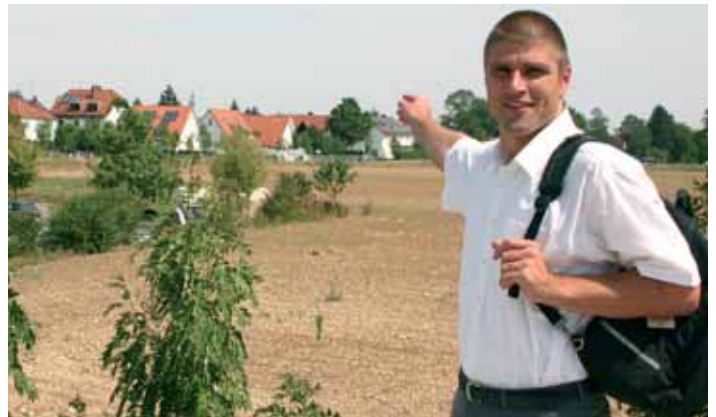
Von den umliegenden S-Bahn-Stationen nur ca. 45-60 min Fußweg zur Messe

Die Transportkapazität der S-Bahn liegt bei ca. 48.000 Fahrgäste pro Stunde in Richtung Messegelände. Dazu muss alle acht Minuten ein