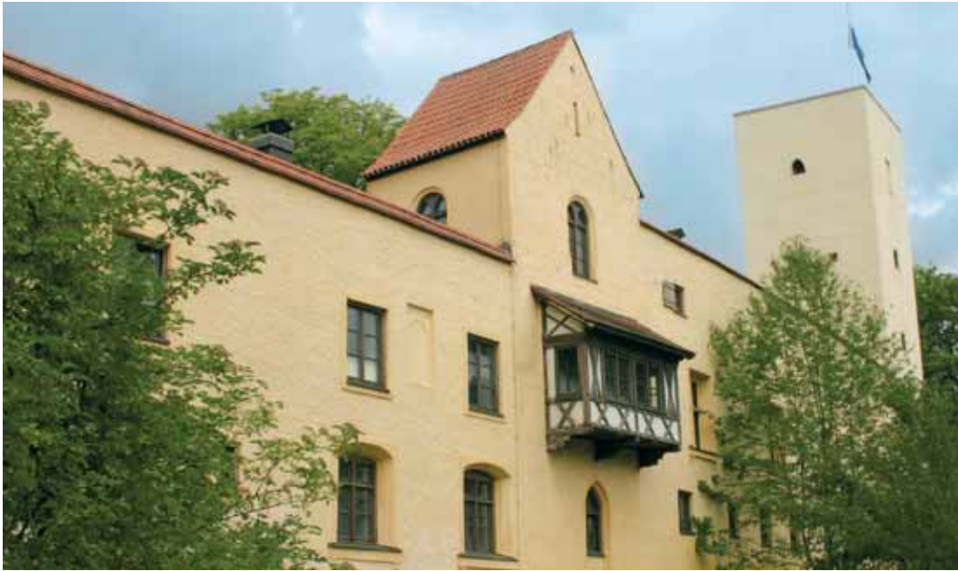
Historisch Im Burgmuseum Grünwald gibt es jede Menge zu sehen und zu bestaunen